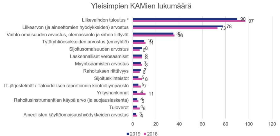
Kuva 2. Yleisimpien KAMien (Key Audit Matters) lukumäärä

Seurannan perusteella keskeisten seikkojen raportoinnissa ei ole tapahtunut merkittäviä muutoksia kolmen vuoden seurantajakson aikana. Kolme selvästi yleisimmin raportoitua tilintarkastuksen kannalta keskeistä seikkaa ovat seurantajakson jokaisena vuonna olleet: